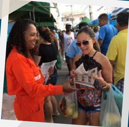
Diálogo com as comunidades - OK