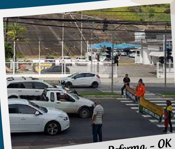
Buzinação contra a Reforma - OK