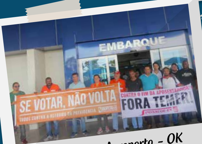
Panfletagem no Aeroporto - OK