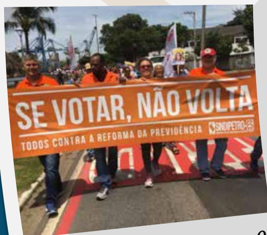
Sindicato no ato contra o retrocesso - OK