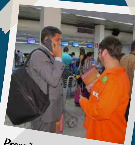
Pressão nos políticos - OK